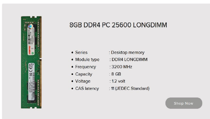
Memory Merk Visipro